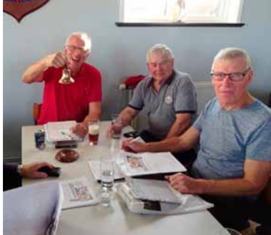
Den nykårede "El Presidente" kalder rosvendene fra Team Torsdag til orden.