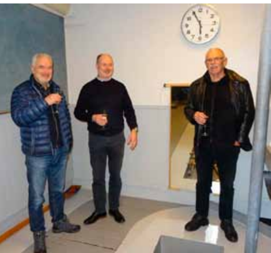
Tre vise mænd fra AR udbringer en skål for projektet og Aalborg Roklub.

Alt i alt en af de helt store fornyelser indenfor vintertræningen. Stor ros til folkene bag det nye vellykkede projekt. Hvilken udvikling der er sket de sidste 50 år, når man tænker tilbage til vintertræningen sidst i 50 erne, hvor der kun blev lukket op for vandet søndag formiddag og vi kun havde gasvarmer på en bruser og motionsapparaterne var hjemmelavede – enten på Aalborg Værft eller hos Gerhardt Christensens maskinfabrik. Vi har stadig ”Maren” torturbænken fra dengang.